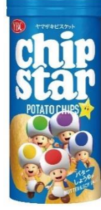
バター しょうゆ × キノピオ