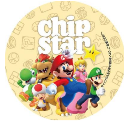
キャップはキャラクター達が集合した にぎやかなデザイン（共通）