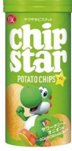
サワークリーム オニオン × ヨッシー