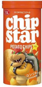
コンソメ × クッパ