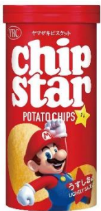
うすしお × マリオ

(※「プレミアムチップスター海老のり味」は2023年8月28日コンビニエンスストア先行発売)