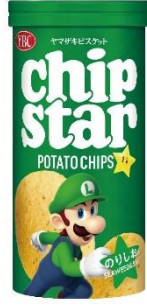
のりしお × ルイージ