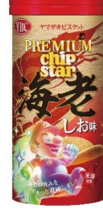
プレミアムチップスター海老 しお味 × 無敵マリオ