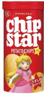
うすしお × ピーチ姫